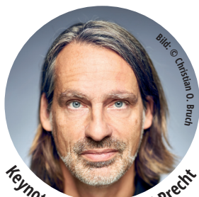
Keynote - Richard David Precht

Holzbau Kompetenz Sachsen GmbH in Kooperation mit der Architektenkammer Sachsen, der Ingenieurkammer Sachsen und der EIPOS GmbH